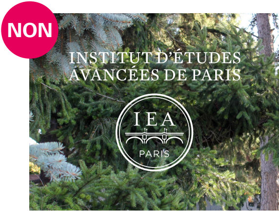
Logotype sur fond photo