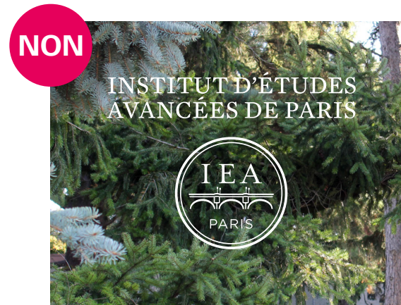
Logotype sur fond photo